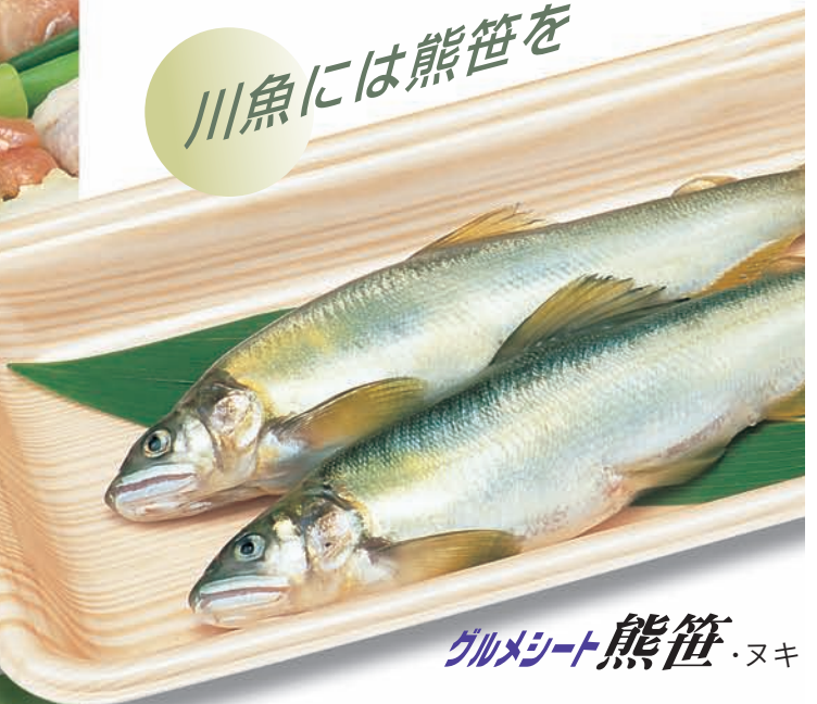
グルメシート熊笹・ヌキ