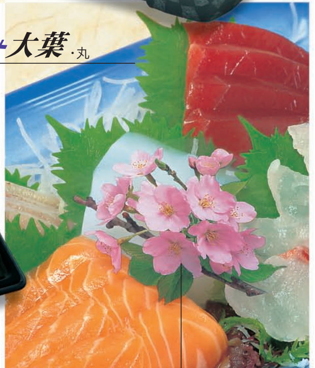
グルメシート桜・丸