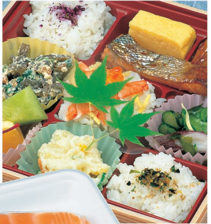
グルメシート三枚笹・ヌキ