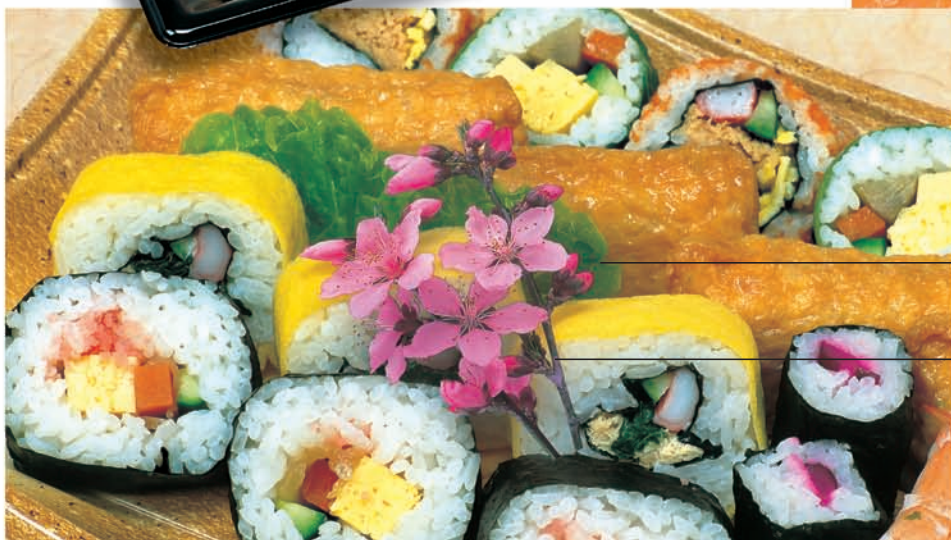
グルメシート桃・丸